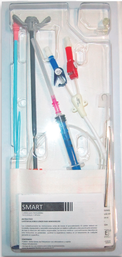
Contenido del equipo